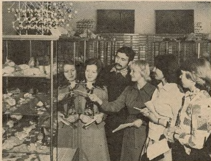
У геалагічным музеі геафака.